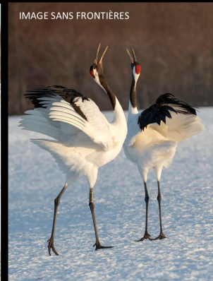
IMAGE SANS FRONTIÈRES