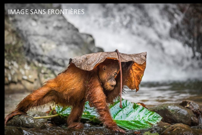
IMAGE SANS FRONTIÈRES