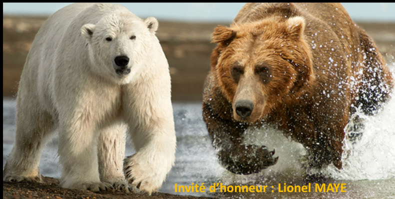
Invité d'honneur : Lionel MAYE