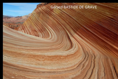
Gérard BASTIDE DE GRAVE